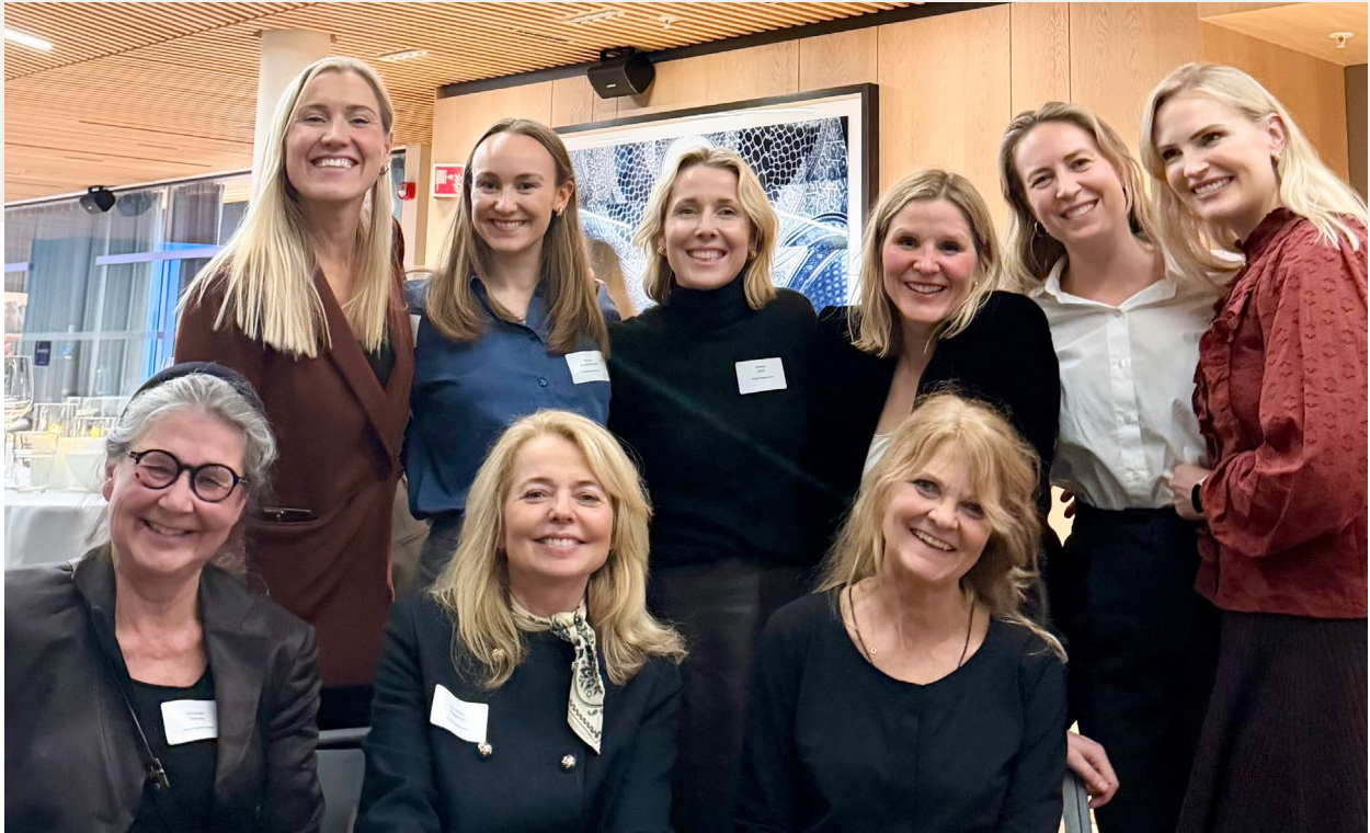
RAs delegasjon til seminar om «Kvinner i skranken»