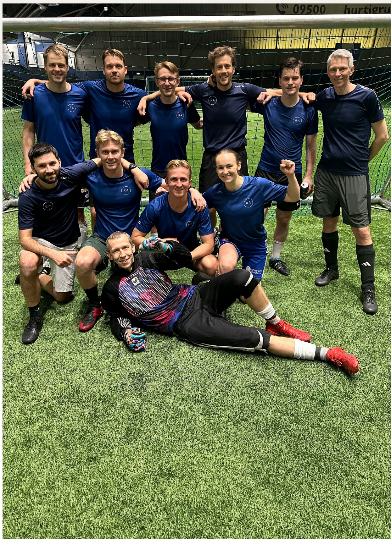
RAS lag til Depcupen i november, der vi tapte knepent i finalen for våre klienter i Finansdepartementet.