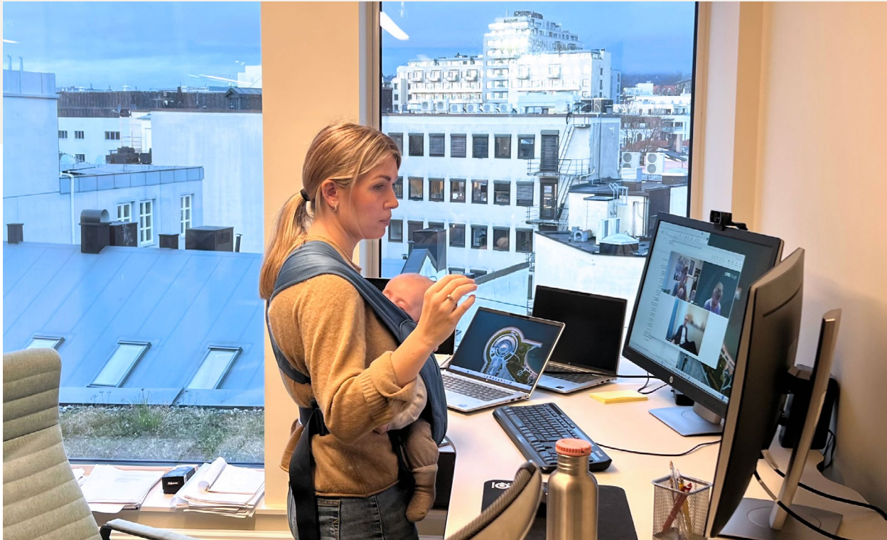
Digitalt saksforberedende møte.