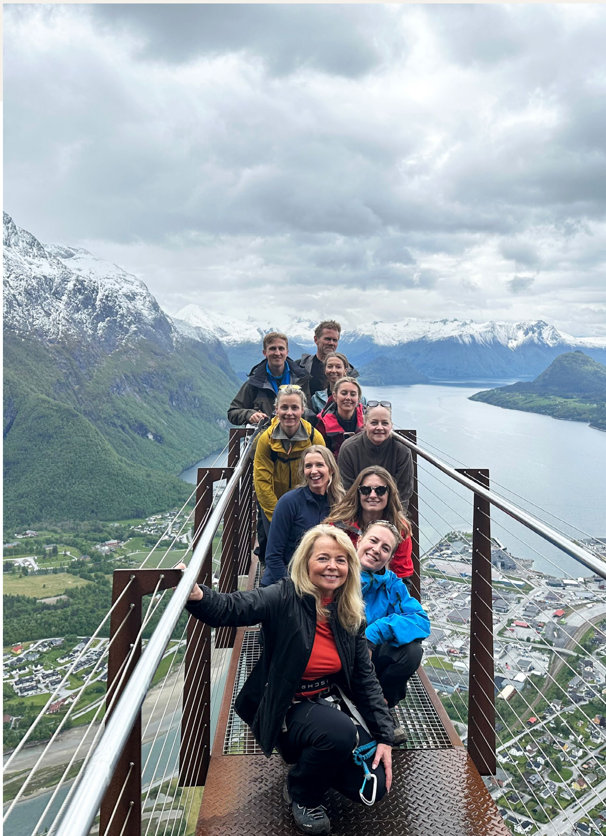
Fra det årlige embetsseminaret, som i år gikk til Åndalsnes.