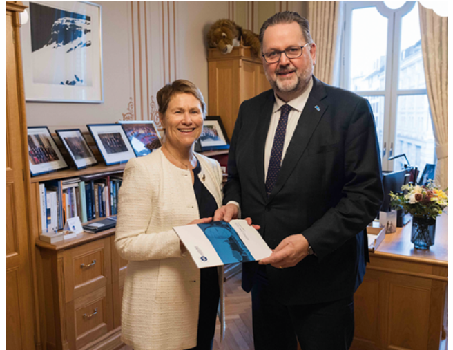
EOS-utvalgets leder Grete Faremo overleverte 26. mars 2025 årsmeldingen for 2024 til Stortingets første visepresident Svein Harberg (Høyre).

En bredere oversikt over EOS-utvalgets eksterne virksomhet i 2025 finnes i vedlegg 1.